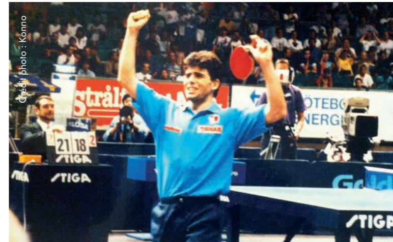
Finale des championnats du Monde - Göteborg, 1993

Sa victoire en finale du Mondial 1993, face au Belge Jean-Michel Saive, constitue une performance unique dans l'histoire de sa discipline. Mais la carrière de Jean-Philippe Gatien ne se résume pas à un seul tour de force. En presque deux décennies au plus haut niveau, il s'est construit un palmarès inégalé : deux médailles olympiques, treize titres de champion de France en simple, dix titres nationaux en double et double mixte. Une carrière qui méritait largement l'hommage rendu par Bercy, à l'occasion du Mondial Ping 2013. Un hommage à son image : simple mais unique.