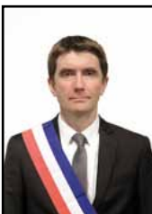
Stéphane GATIGNON Maire de Sevrans