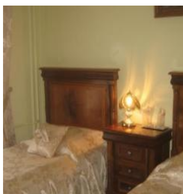
L'hôtel Cora pouvant accueillir de nombreux joueurs