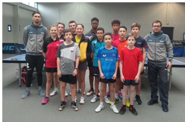
Délégation Val d'Oise