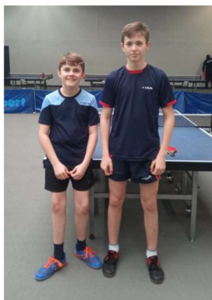
Délégation de la Norvège