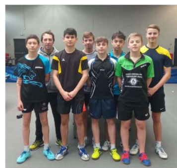
Délégation du Luxembourg

Jeunes – 2 Cadres – 1 Jeune en formation