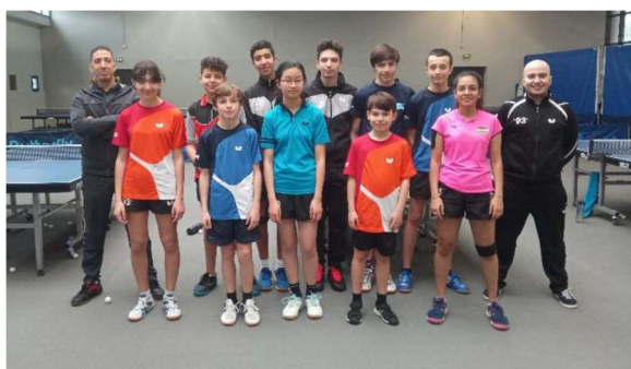
Délégation du CD 93

Ce stage de perfectionnement Minimes/Cadets/Juniors s'est déroulé au CDFAS d'Eaubonne en collaboration avec le CD95TT et 9 Joueurs étranger (Norvégiens et Luxembourgeois). Pendant une semaine, du Lundi 10 Février 2020 au Vendredi 14 Février 2020 , nos 30 jeunes pongistes, encadrés par 6 entraîneurs (dont 1 en formation CQP) et 2 relanceurs, ont pu s'entraîner et profiter de la structure du CDFAS, qui nous a mis à disposition de superbes moyens d'exercice.