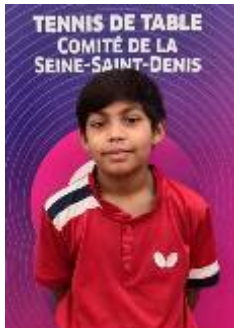
NAGGAEA Krishi Neuilly Sur Marne TT