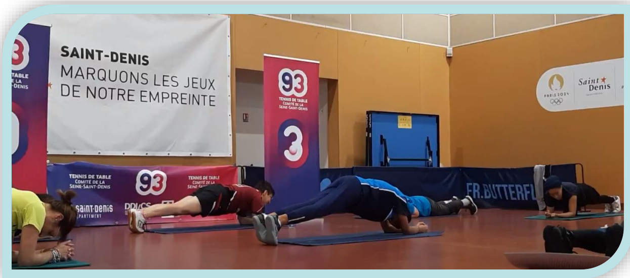
Après des séances de gainages et d'abdos sont venus les étirements.